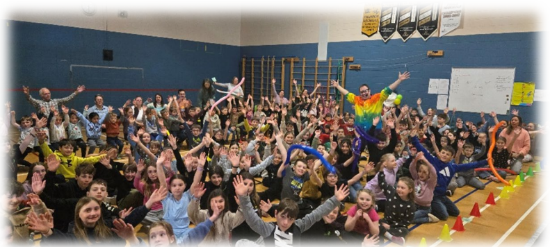
Spectacle La magie de la chimie